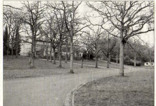
Bürgermeister Breyer regte an, im Rahmen der Dorferneuerung zu untersuchen, ob das Umfeld der Mehrzweckhalle ein neues Gesicht erhalten könnte.

Durch die Dorferneuerung könne beispielsweise so manches im öffentlichen, gemeinschaftlichen und privaten Bereich verändert werden, beant-