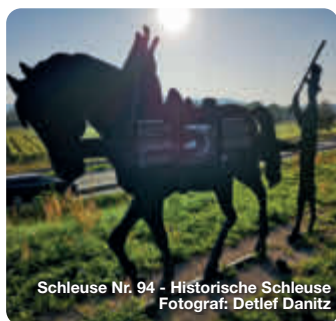
Schleuse Nr. 94 - Historische Schleuse