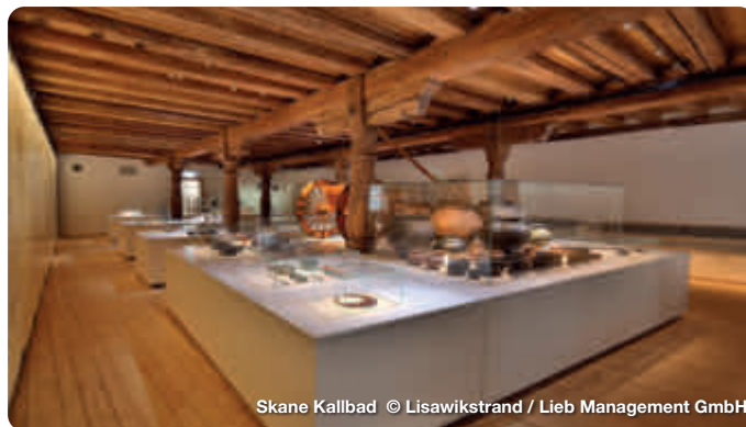
Skane Kallbad