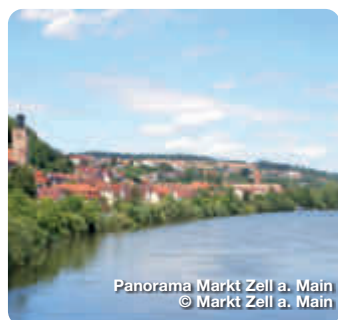
Panorama Markt Zell a. Main