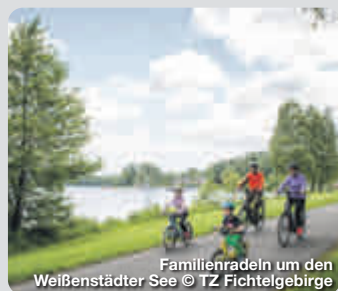
Familienradeln um den Weißenstädter See