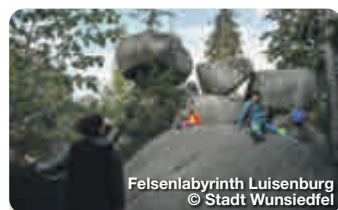
Felsenlabyrinth Luisenburg

Das imposante Koppentor oder die zahlreichen Brunnen machen einfach nur Spass entdeckt zu werden. Ob im Alleingang oder mit unseren ausgebildeten Gästeführern, Sie werden erstaunt sein über die reizvollen Zeitzegen, originellen Geschichten und verwunschenen Winkel unserer Festspielstadt. TreffpunktDeutschland.de/wunsiedel