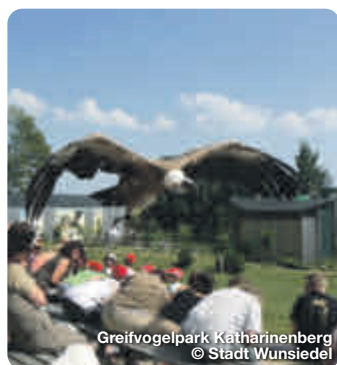
Greifvogelpark Katharinenberg

Mehr als nur ein Automuseum: Automobil-Klassiker, Traumaautos, Prototypen, Rennsportwagen, Kleinwagen, Motorräder, Flugzeuge, Hubschrauber. Ein Muss für alle Autoliebhaber & Technikinteressierten. Nagler Weg 9-10, Fichtelberg