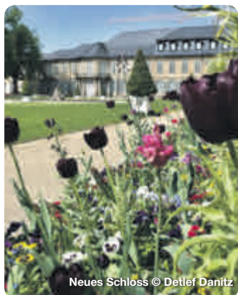
Neues Schloss