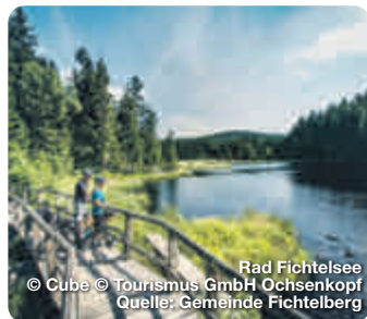
Rad Fichtelsee

großen Nachbarn der Metropolregion verstecken. Die hübsche historische Altstadt mit vielfältigen Shopping-Möglichkeiten, das Neue Schloss mit dem Hofgarten und, etwas außerhalb, die Eremitage sind Zeugnisse einer schillernden Vergangenheit. TreffpunktDeutschland.de/bayreuth