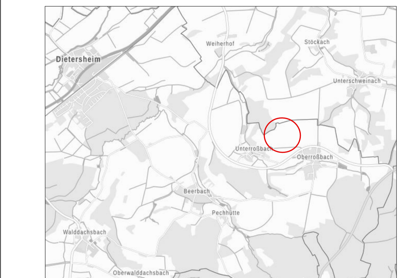
Kartengrundlage: Geobasisdaten © Bayerische Vermessungsverwaltung 2022