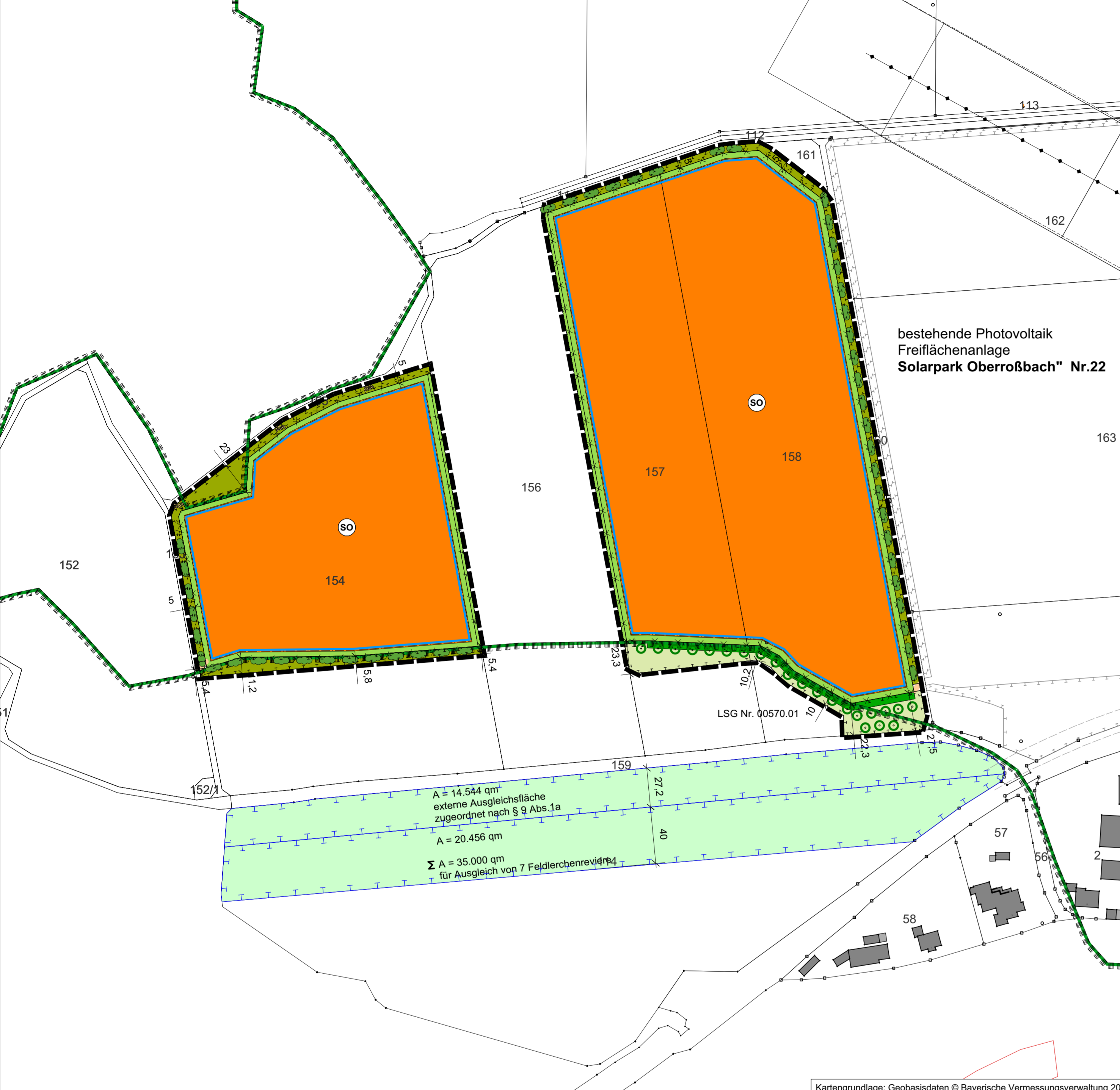
Kartengrundlage: Geobasisdaten © Bayerische Vermessungsverwaltung 2022

Bekanntmachung vom 03.11.2017 (BGBl. I S. 3634), zuletzt geändert durch Artikel 2 des Gesetzes vom 04.01.2023 (BGBl. I Nr.6) und des Art. 23 der Gemeindeordnung für den Freistaat Bayern (Gemeindeordnung - GO) i. d. F. der Bekanntmachung vom 22.08.1998 (GVBl. S. 796, BayRS 2020-1-1), zuletzt geändert durch § 2 des Gesetzes vom 09.12.2022 (GVBl. S. 674) sowie des Art. 81 der Bayerischen Bauordnung (BayBO), i. d. F. der Bekanntmachung vom 14.08.2007 (GVBl. S. 588, BayRS 2132-1-B), zuletzt geändert durch § 2 des Gesetzes vom 23.12.2022 (GVBl. S. 704) und der Verordnung über die bauliche Nutzung der Grundstücke (Bauutzungsverordnung - BauNVO) i. d. F. der Bekanntmachung vom 21.11.2017 (BGBl. I S. 3786), zuletzt geändert durch Artikel 3 des Gesetzes vom 04.01.2023 (BGBl. I Nr.6), diesen Bebauungsplan als Satzung.