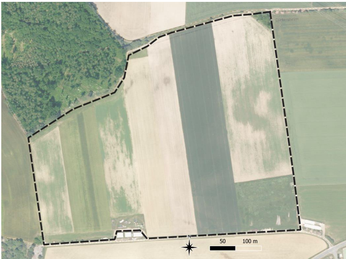
Abbildung 1: Lage der Planungsfläche

Quelle für Luftbild: WMS-Server DOP80 der bayer. Vermessungsverwaltung, Landesamt für Digitalisierung, Breitband und Vermessung; https://geoservices.bayern.de/wms/v2/ogc_dop80_oa.cgi?