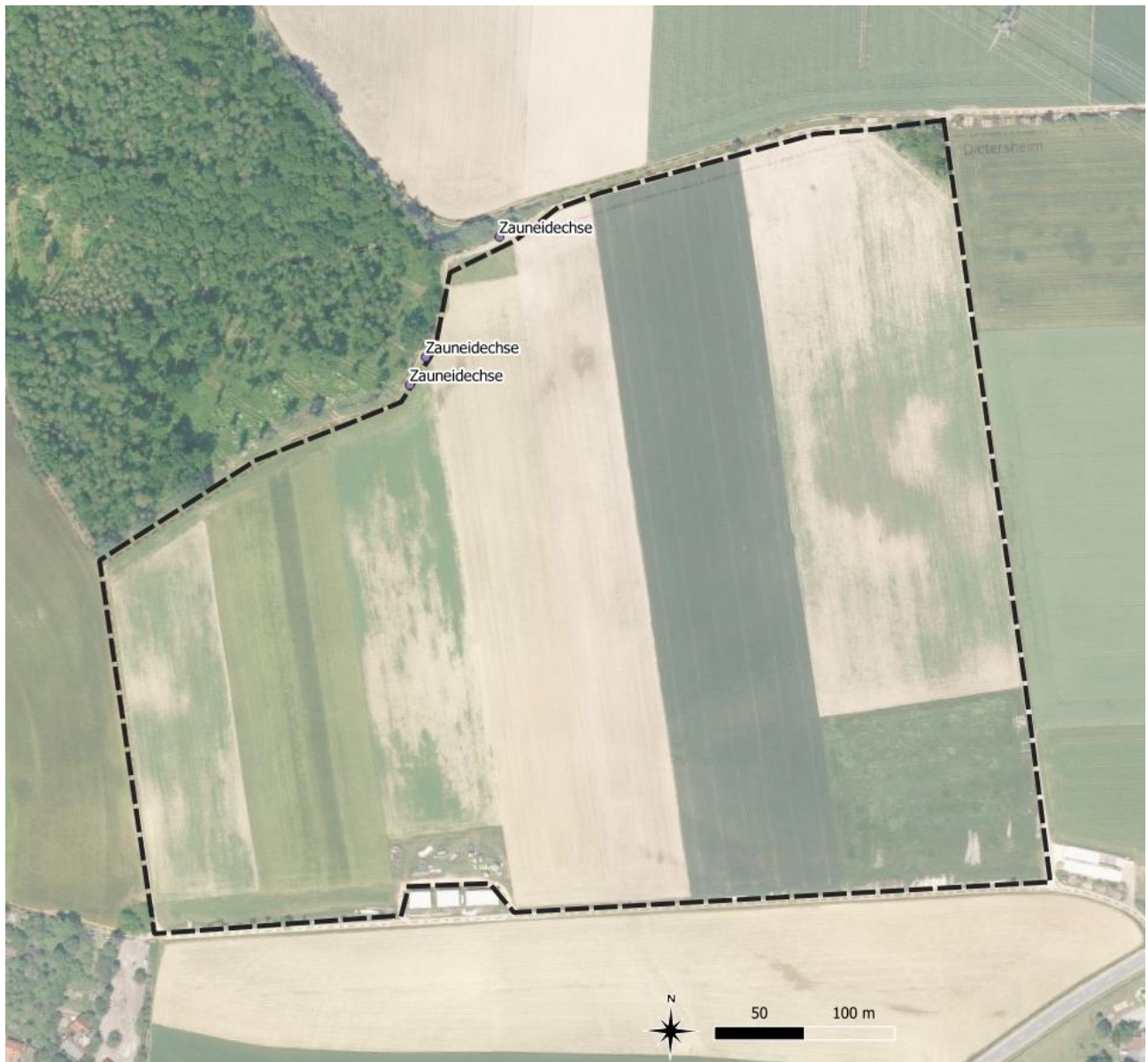
Abbildung 5: Zauneidechsen-Fundpunkte