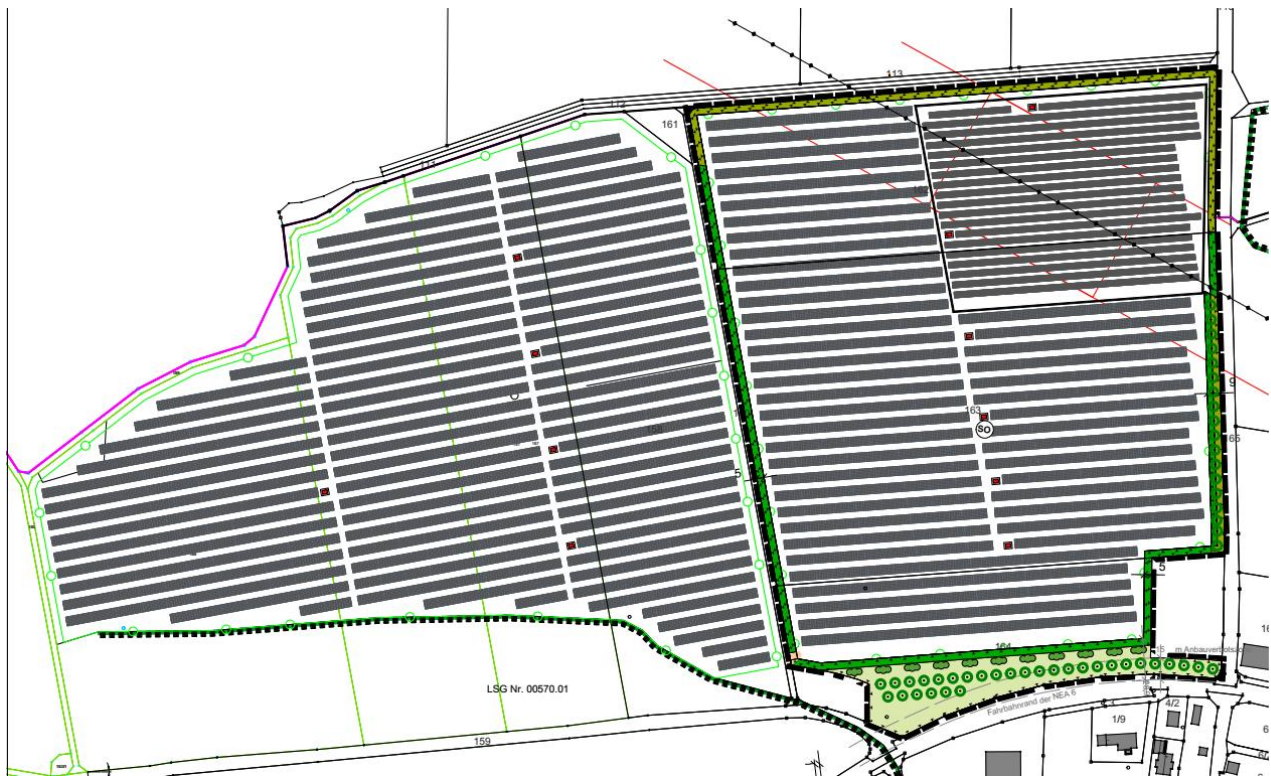
Abbildung 3: Modulbelegungsplan