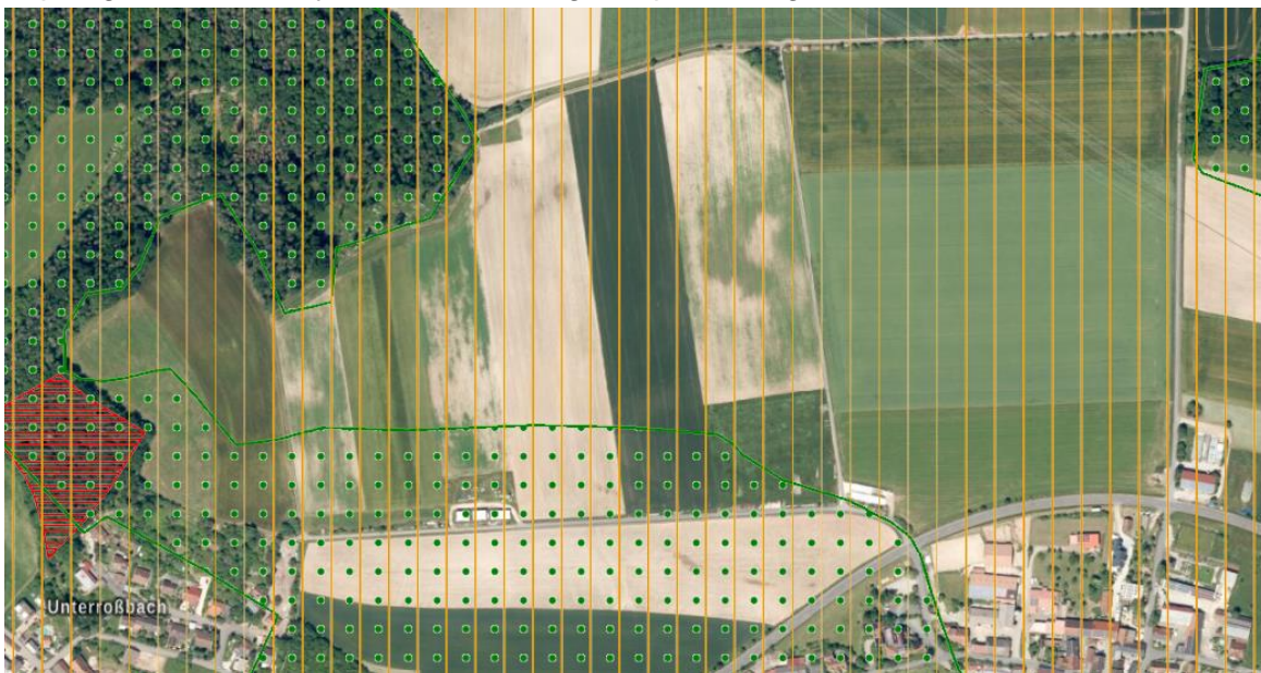
Abbildung 2: Schutzgebiete