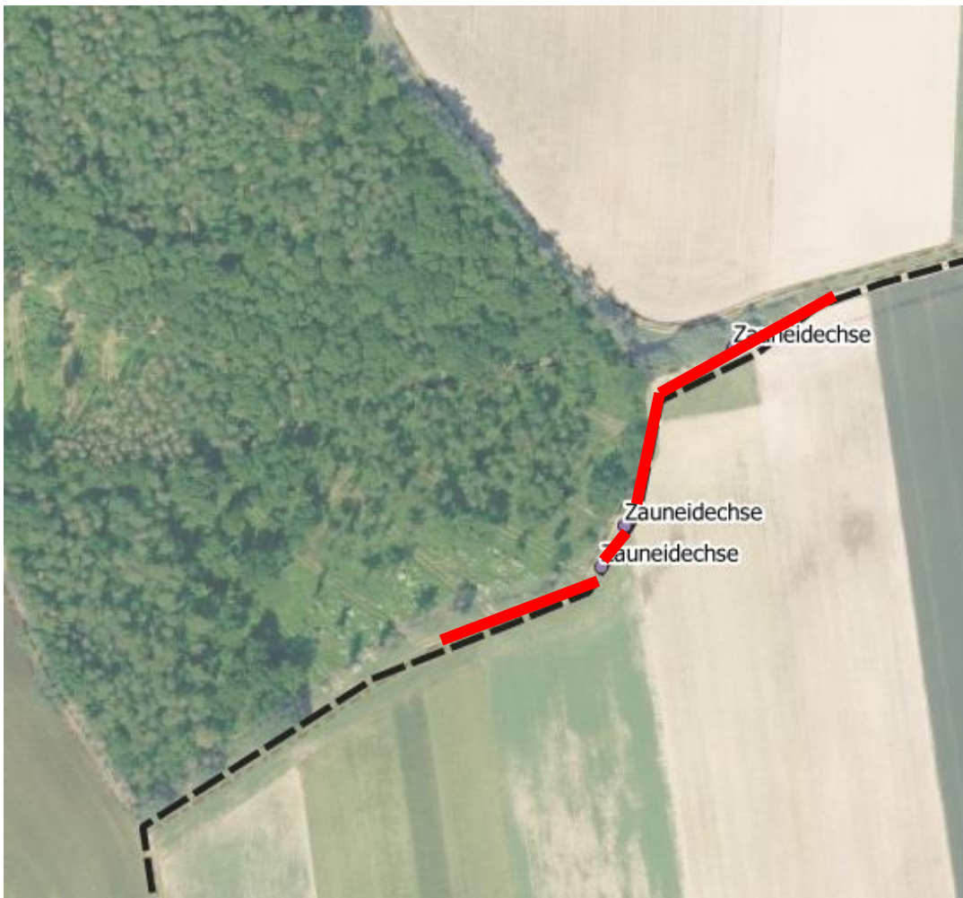
Abbildung 9: Lage der Vermeidungsmaßnahme V2

Rote Linie: bauzeitliche Abzäunung des Waldrandes gegenüber Baustelle für PV-Anlage