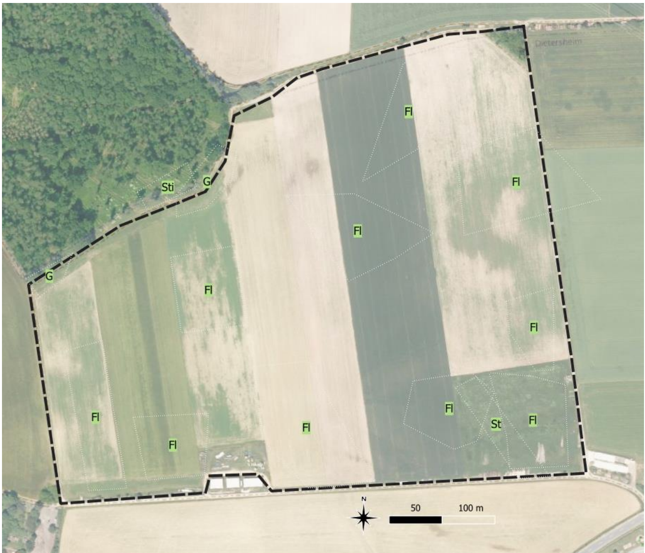
Abbildung 4: Reviermittelpunkte saP-relevanter Offenland-Vogelarten: Feldlerche und Schafstelze

FI: Feldlerche St: Schafstelze G: Goldammer