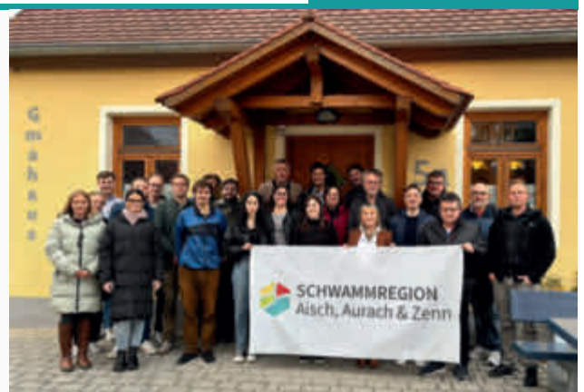
Die Teilnehmer des Zweiten Schwammtischs in Oberfeldbrecht/Neuhof a.d.Zenn.

Der nächste Schwammtisch findet Anfang 2026 statt. Zudem sind Veranstaltungen für die Landwirte und kommunalen Bauhöfe in Planung.