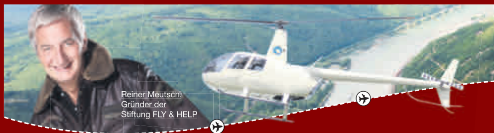
Reiner Meutsch, Gründer der Stiftung FLY & HELP